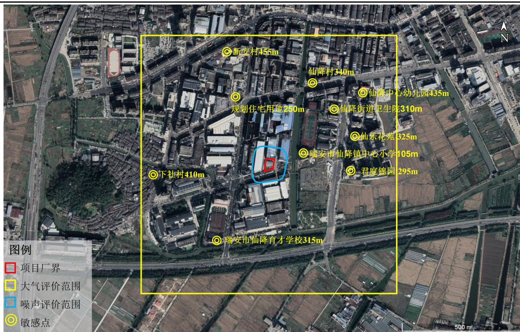
图 3-1 环境保护目标示意图